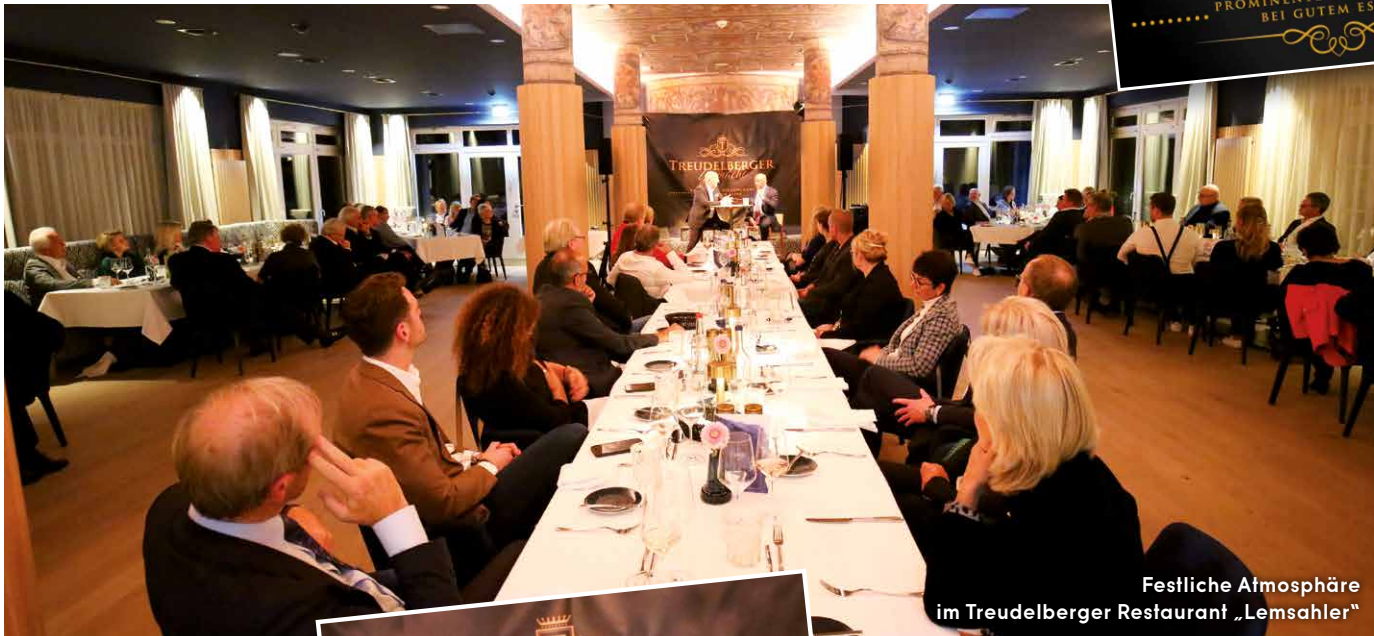
Festliche Atmosphäre im Treudelberger Restaurant „Lemsahler“

Wunderbares Hamburger Talk- Format gestartet. TREUDELBERGER GESPRÄCHE.