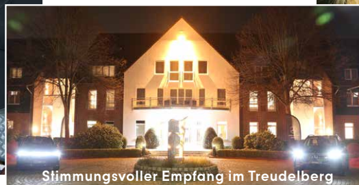
Stimmungsvoller Empfang im Treudelberg